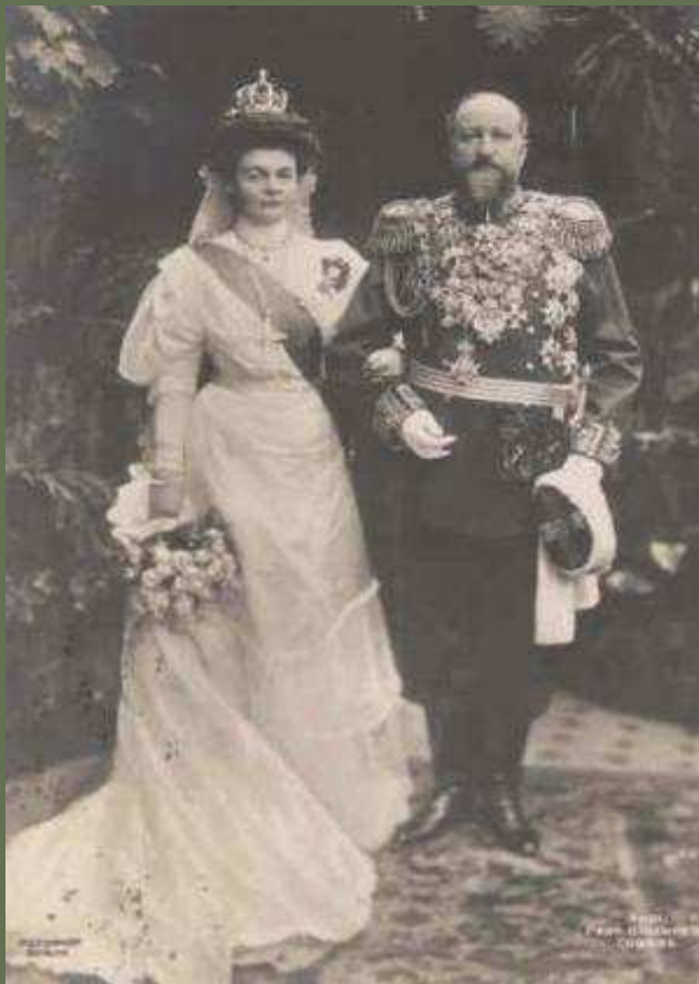
Царица Елеонора и Цар

„Царствения бял ангел с червения кръст“ - многолика и огромна дейност , невероятна дипломация относно етноса, работа сред армията, усъвършенстване на милосърдното дело и себеотдаване за България