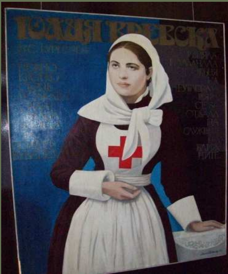
Юлия Вревская 1841 - 1878

През 1876 г. баронеса Вревская преминава спешен курс на обучение за медицинска сестра и със собствени средства подготвя още един отряд доброволки за фронта