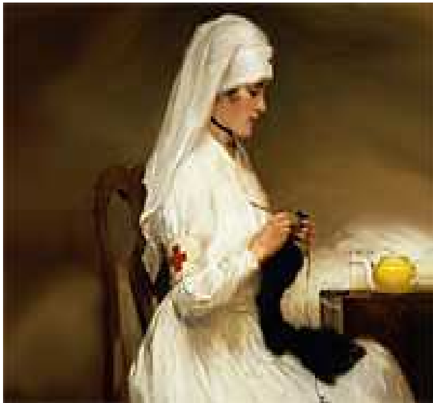
Флоранс Найтингейл 1820 - 1910

Реформаторка на много военни и граждански болници - смъртността в лазаретите за 6 месеца спада от 42 на 2 процента