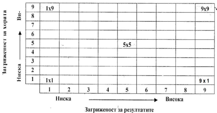
Фиг. 2 Мениджърска решетка на Блейк и Мутон (от учебника по Управление на здравните грижи).

Разгледайте мениджърската решетка на Блейк и Мутон, при която стила на лидерство/мениджмънт се определя от ударението, което се поставя върху изпълнението на задачите и от взаимоотношенията между хората в екипа. Дайте наименованията и основните характеристики на основните измерения: 1x1, 1x9, 9x1, 9x9, 5x5.