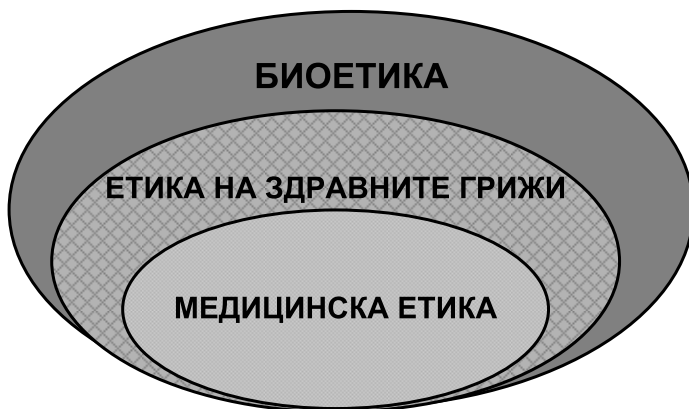
Фиг. 1 Връзка между биоетика, етика на здравните грижи и медицинска етика

В този смисъл едно по-всеобхватно определение за етиката я представя като наука, която търси отговор на въпроса кое е добро ; изследва кое действие е правилно или неправилно и по такъв начин тя спомага за изясняване на моралните измерения на човешкото поведение. Отговорите на тези въпроси, обаче, могат да бъдат много разнообразни, което обяснява хетерогенността на науката. Етиката допуска различни гледни точки, различни методи и теории за достигане до определено етично решение.