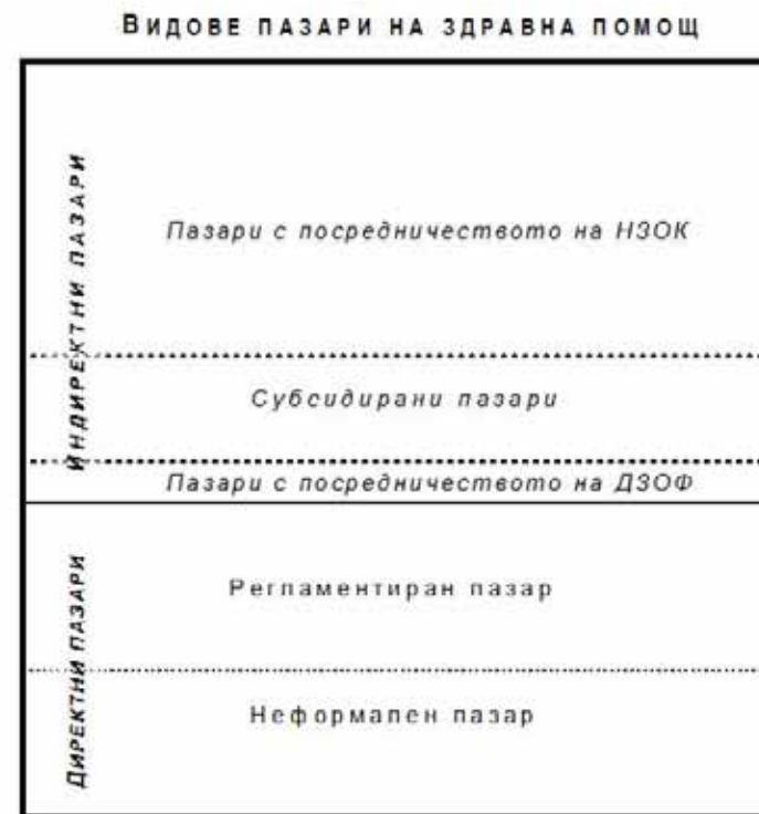
Фиг. 15. Видове пазари в здравния сектор

независимо от това кой заплаща цялата цена или част от нея. Все повече се прилагат квазипазарни форми и в субсидираните от държавата и общините дейности. Поради това може да се използва термина „субсидирани пазари“ за тези дейности, при които се прилага нов публичен мениджмънт – договаряне на бюджети или финансиране на база дейност.