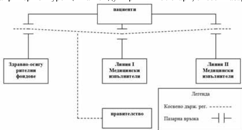
фиг. 13 Свободен хипотетичен пазар на частни медицински услуги (косвено регулиране чрез общите данъчни условия)

На фиг. 13 и 14 са представени видовете пазарни и непазарни отношения (регулиране) в свободен хипотетичен пазар и в реален пазар на частни медицински услуги по Р. Еванс -1981. Пролитчава, че и в максимално свободния, но реален пазар на частни медицински услуги се вметват множество непазарни връзки като: държавно субсидиране (инвестиции) и регулиране на болниците и други структури от втора линия.; индуциране на по-голямо търсене от първичните лекари; съсловно саморегулиране; влияние на първичните лекари върху звената от втора линия и регулиране от здравно осигурителните фондове. В повечето страни с национално здравно осигуряване, но с използване на отделни пазарни елементи (като например конкуренцията между първичните лекари, смесен пазар)