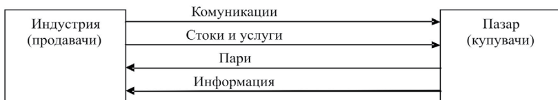
Фиг. 1. Маркетингова схема

Опростена маркетингова схема е предложена на фиг. 1.