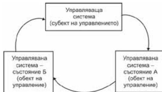
Фиг. 5. Управленски процес в здравеопазването

Както всеки управленски процес, здравният мениджмънт представлява целенасочено въздействие на една система (управляваща) върху друга система (управлявана), с оглед постигането на определени цели и реализация на здравнополитическата стратегия (фиг. 5).