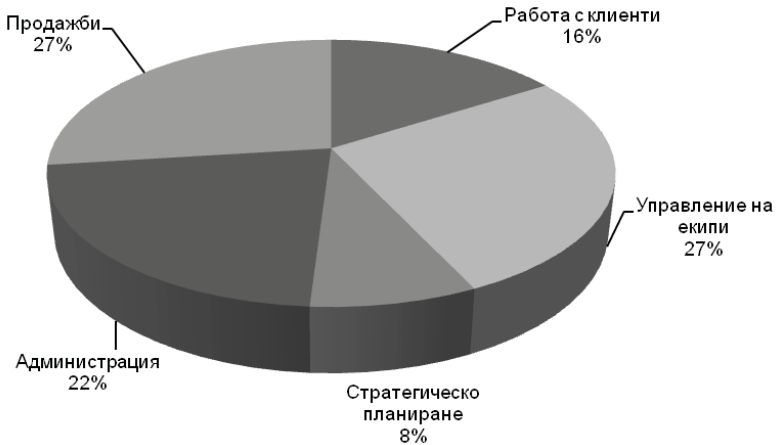
Фиг. 22. Времево разпределение по видове дейности

Препоръчително е извършваната оценка и ревизия на разходите от време да обхваща както професионалното, така и личното време. Управлението на времето не е само инструмент за подобряване на служебната ефективност, но и за постигане на по-добър баланс в личния живот. Примерно времево разпределение на мениджърските дейности е показано на фиг. 22 .