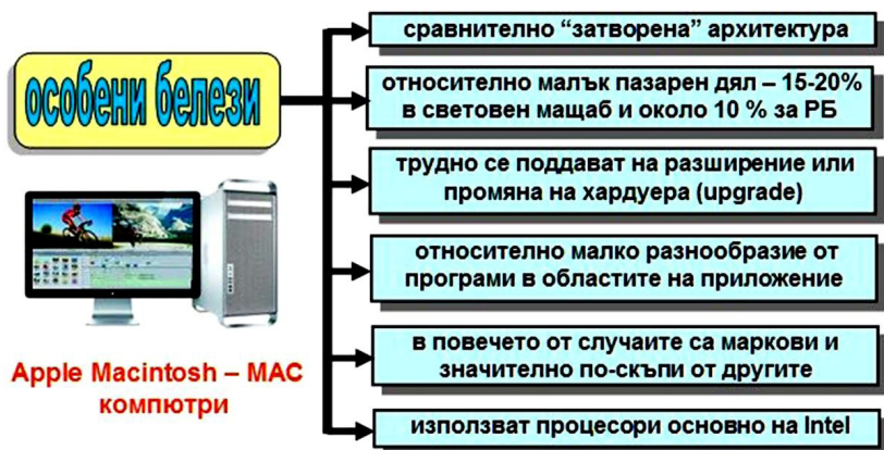
Фиг. 11. Особенности на Apple съвместими персонални компютри.

Компютрите с търговска марка Макинтош (Macintosh) или просто MAC са втората категория компютри. Те владеят останалта част на пазара. Тези компютри са разработка и в основния си дял производство на фирмата Apple. Техните особености и белези са в значителна степен противоположни на IBM PC компютрите. Посъществените от тях са показани схематично на Фиг. 11.