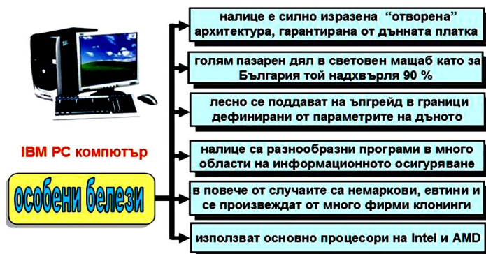
Фиг. 10. Особенности на IBM съвместими персонални компютри.

Лицензите за разработените от IBM PC компютри са закупени от Китайската фирма Lenovo, която сега е основният производител на тези машини и световен лидер. По данни на различни литературни източници IBM PC съвместимите компютри понастоящем владеят около 80 процента от пазара на персоналните компютри в света и около 90 процента от този в България. Основанието за този голям пазарен дял е многостранно. То се базира на няколко по-съществени белези, показани схематично на Фиг. 10.