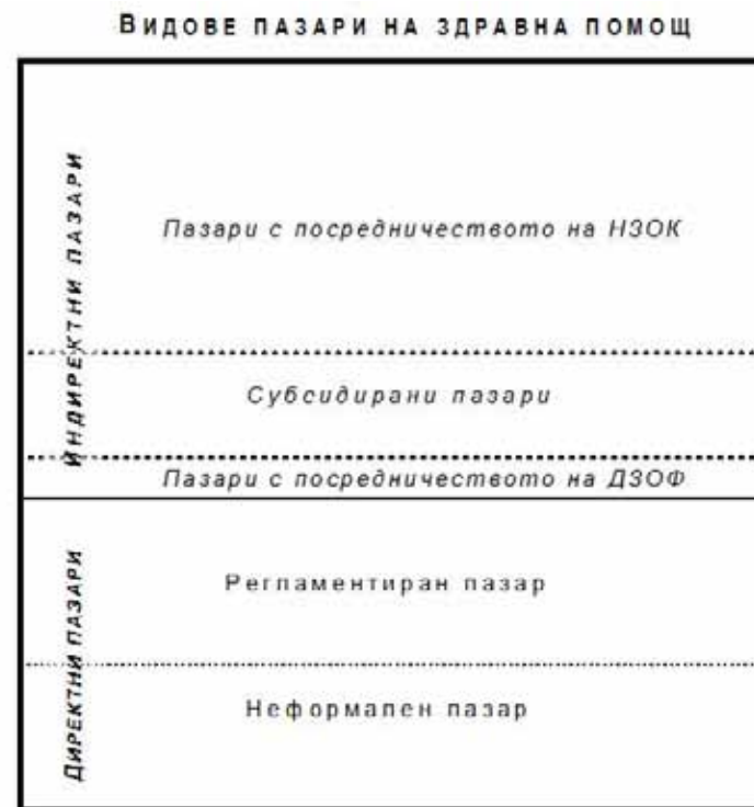
Фиг. 15. Видове пазари в здравния сектор

независимо от това кой заплаща цялата цена или част от нея. Все повече се прилагат квазипазарни форми и в субсидираните от държавата и общините дейности. Поради това може да се използва термина „субсидирани пазари“ за тези дейности, при които се прилага нов публичен мениджмънт – договаряне на бюджети или финансиране на база дейност.