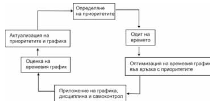
Фиг. 20. Управление на времето

Следователно, съвременната теория за управление на времето е насочена към определяне на приоритетите, извършване на важните дейности за постигане на целите, самоконтрол и дисциплина в изпълнението на планираните дейности. На фиг. 20 е изобразен примерен цикъл за управление на времето.