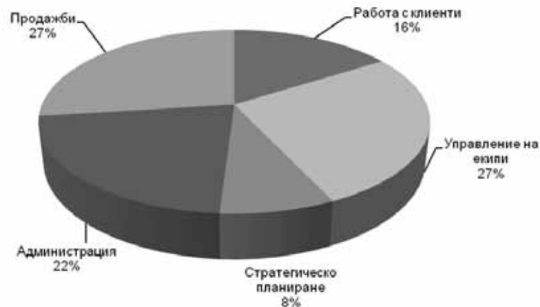
Фиг. 22. Времево разпределение по видове дейности

Препоръчително е извършваната оценка и ревизия на разходите от време да обхваща както професионалното, така и личното време. Управлението на времето не е само инструмент за подобряване на служебната ефективност, но и за постигане на по-добър баланс в личния живот. Примерно времево разпределение на мениджърските дейности е показано на фиг. 22 .