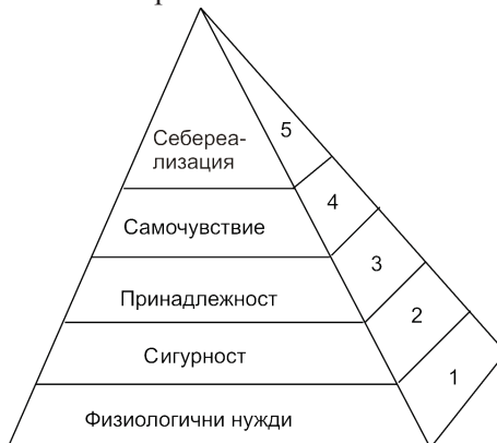
Фиг. 1. Модел на Maslow за йерархията на потребностите

потребности (фиг. 1). Maslow задълбочава изследванията върху социално-психологическите аспекти и механизми на мениджмънта и специално върху професионалната мотивация чрез развитие на теорията за човешките потребности.