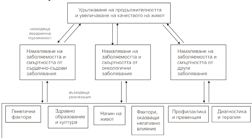
Фиг. 3. Пирамида на здравнополитическите цели

В управленския процес много често едни цели се явяват подцели на други, като последните са обикновено обществени и дългосрочни. Следователно може да се определи йерархията на целите, тяхното подчинение, вътрешна координация и взаимодействие – фиг. 3 .