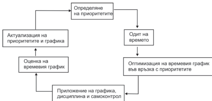
Фиг. 20. Управление на времето