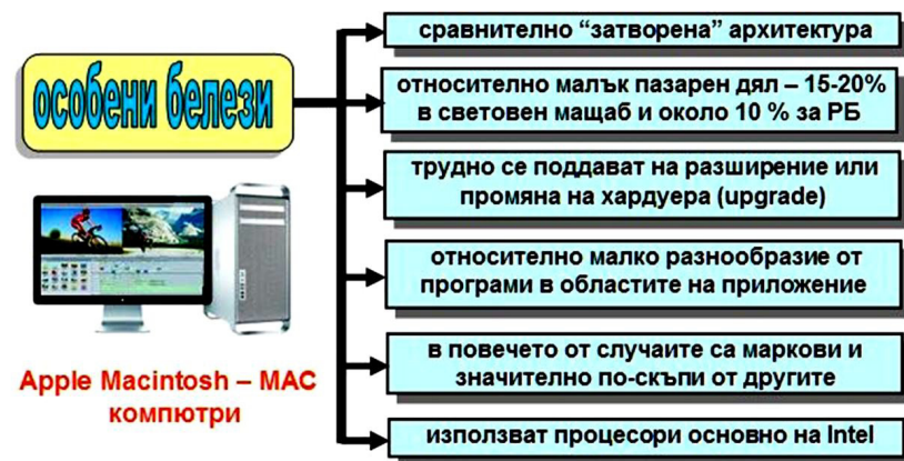
Фиг. 11. Особенности на Apple съвместими персонални компютри.

Компютрите с търговска марка Макинтош (Macintosh) или просто MAC са втората категория компютри. Те владеят останалта част на пазара. Тези компютри са разработка и в основния си дял производство на фирмата Apple. Техните особености и белези са в значителна степен противоположни на IBM PC компютрите. Посъществените от тях са показани схематично на Фиг. 11.