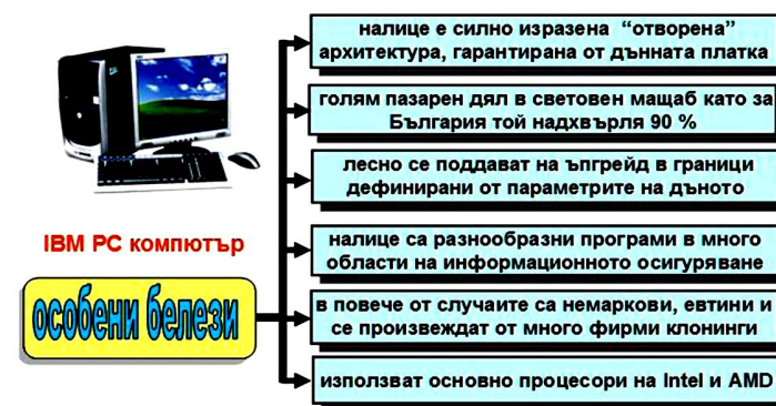
Фиг. 10. Особенности на IBM съвместими персонални компютри.

Лицензите за разработените от IBM PC компютри са закупени от Китайската фирма Lenovo, която сега е основният производител на тези машини и световен лидер. По данни на различни литературни източници IBM PC съвместимите компютри понастоящем владеят около 80 процента от пазара на персоналните компютри в света и около 90 процента от този в България. Основанието за този голям пазарен дял е многостранно. То се базира на няколко по-съществени белези, показани схематично на Фиг. 10.