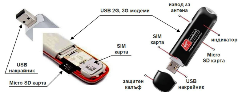
Фиг. 21. Модеми за безжични комуникации 2G, 3G.

Стандартите HSDPA са UMTS базирана технология от трето поколение, която позволява теоретично скоростта на пренос на данните при Download да достигне до 14.4 Mbit/s. На практика това зависи от много условия, едно от които е използваните устройства за предаване (клетките) и тези за приемане (модемите). В различните райони и градове на страната покритието с 3G е различно, като операторите често публикуват на сайтовете си карта за това. Скоростите са също много различни и твърде условни.