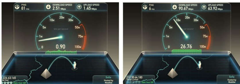
Фиг. 18. Тест за скоростта на Интернет доставката.

Тестовите възможности на този сайт за определяне на скоростта към Интернет адреси на територията на страната са адаптирани от оператора „Мегалан Нетуърк“ ( https://www.megalan.bg ). Поради това за извършване на тестването със сървъри, комутиращи Интернет трафика в страната може да се избере директно на адреса на този оператор http://megalan.speedtest.net/ , но това не е задължително.