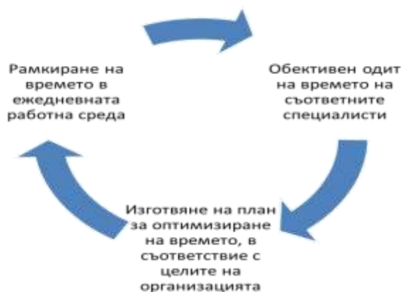
Фиг. 5.2. Процес на оптимизиране на времето