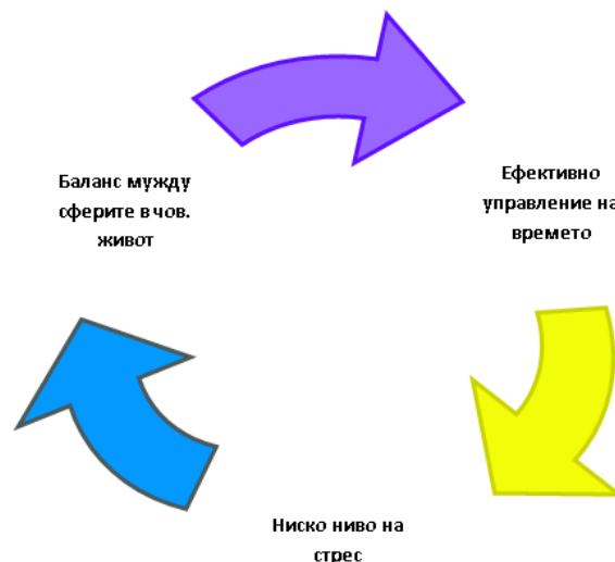
Фиг. 7.2. Взаимозависимост между ефективното управление на времето и стреса

Управлението на времето е средство за постигане на баланс в живота! Постигането на житейски баланс е основна цел на ефективното управление на времето.