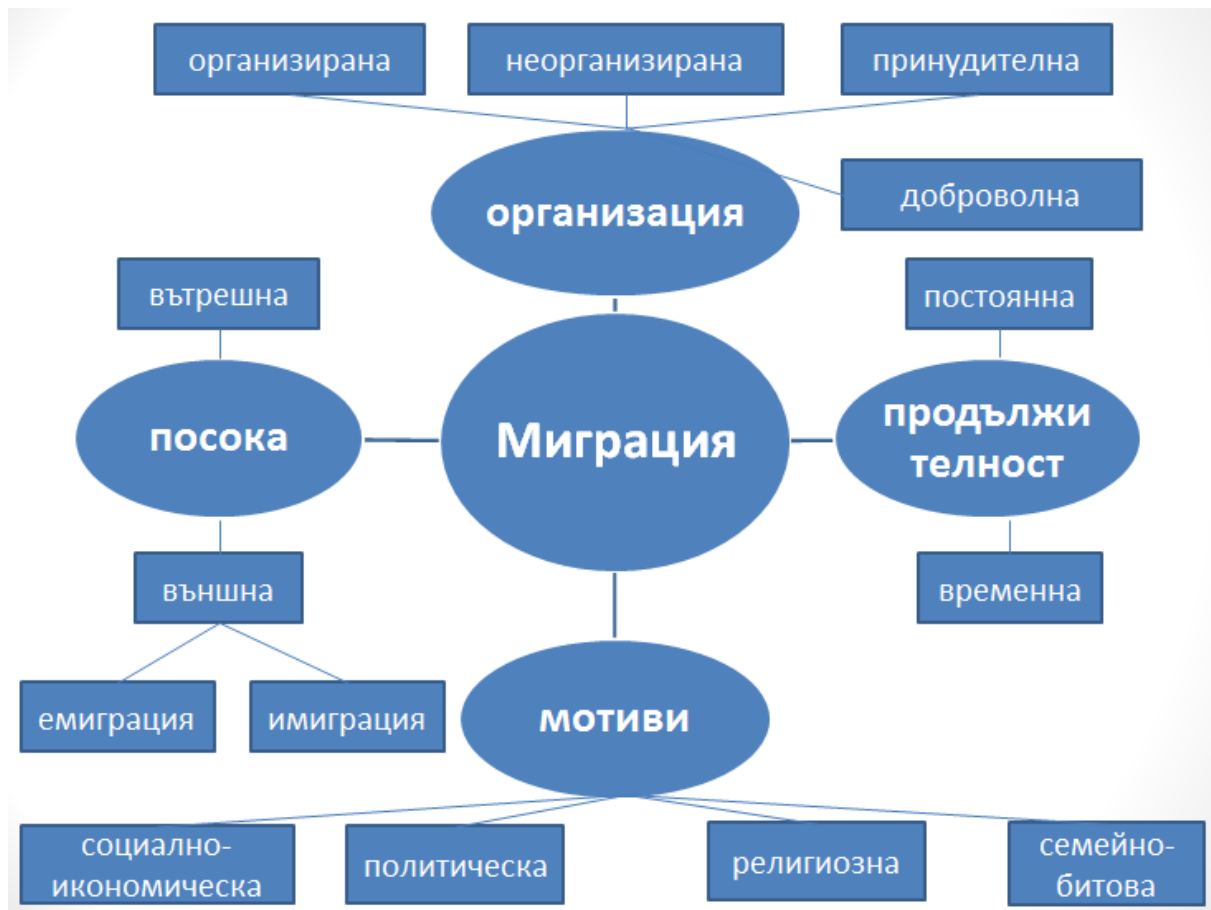
Фиг. 1 Видове миграция

Миграция - Движение на дадено лице или група лица през международна граница или в рамките на една държава. Това е движението на населението, която обхваща всякакъв вид движение на хора, независимо от неговата дължина, състав и причини; тя включва миграция на бежанци, разселени лица, икономически мигранти и лица, движещи се и за други цели, включително събиране на семейството.